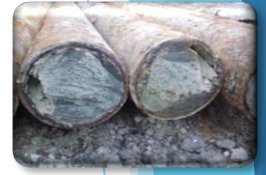
充填状況 (施工実証)